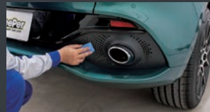
樹脂パーツの黒色、艶を守る。