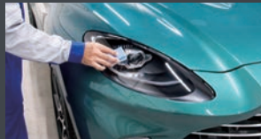
ヘッドライト・テールレンズの白ボケ・黄ばみを防ぐ。