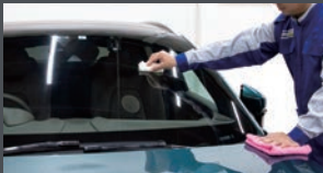
圧倒的な撥水力で雨の日の視界確保。