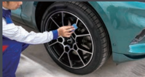
分厚いガラス被膜でホイールを守る。