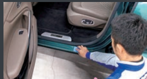
11 ドア内側のステップ部分