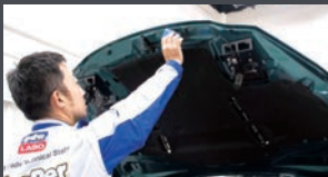
外から見えない塗装がされているあらゆる部分にTREXキーパーを施工。