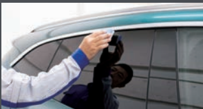
樹脂素材に適した専用コートで守る。