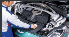
12 エンジンルームの中